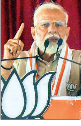
अलीगढ़

प्रधानमंत्री नरेंद्र मोदी ताबड़तोड़ चुनावी रैली कर रहे हैं। चुनावी सभा में पीएम मोदी विपक्ष पर जमकर निशाना साधा रहे हैं। अलीगढ़ की चुनावी सभा में उन्होंने साफ शब्दों में कह दिया कि हमारी माताओं-बहनों के पास सोना होता है, जो अवसरों पर तुरंत शरीर पर पहनकर प्रभाव पैदा करने के लिए नहीं होता। वह खीन धन होता है। पवित्र माना जाता है। कानून भी उसकी रक्षा करता है। इनकी (कांग्रेस) नजर कानून बदलकर हमारी माताओं-बहनों के मंगलसूत्र पर है। वो सर्वे करना चाहते हैं कि जो नौकरीपेशा हैं। उन्होंने अपने बच्चों की पढ़ाई और शादी के लिए कितनी एफडी कर रखी है। पीएम ने कहा कि समाजवादी पार्टी और कांग्रेस के परिवारवाद, भ्रष्टाचार में तुष्टिकरण की फैक्ट्री पर ऐसा ताला लगाया कि दोनों शहजादों (राहुल और अखिलेश) को आज तक चाबी नहीं मिली। विकसित भारत की चाबी जनता के पास है। कांग्रेस के भ्रष्टाचार पर ताला लगाना है। परिवारवाद की राजनीति को खत्म करना है। इसलिए बिना किसी देरी के परिवारवाद की फैक्ट्री पर हमेशा के लिए अलीगढ़ का ताला जड़ देना चाहिए।