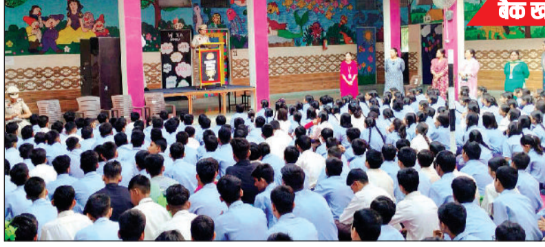
बैक खाते, पैनकार्ड, आधार कार्ड की जानकारी किसी को न दें

व्हाट्सएप पर अनजान नंबर से विडियो कॉल को नजरअंदाज करें, साथ ही पुलिस को सूचना दें